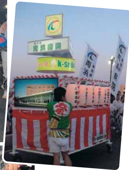
新潟祭り 大民謡流し